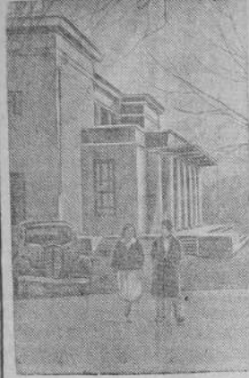
Здание Таджикского Государственного театра имени Лаути в гор. Сталинабаде.

В № 7-8 журнала «Большевик» напечатана статья П. Москатова «Государственные трудовые резервы СССР». Одним из решающих условий выполнения народнохозяйственных задач является систематическая, вдумчивая, всесторонняя подготовка и пополнение состава рабочего класса СССР новыми кадрами рабочих массовых профессий и квалифицированных рабочих. Тов. Москатов пишет, что только за 1941 год школы фабрично-заводского обучения дадут нашей промышленности и транспорту около 800 тысяч рабочих массовых профессий. В целях успешного развития молодой промышленности советских республик, по решению ЦК ВКП(б) и Совнаркома СССР, в этих новых социалистических республиках